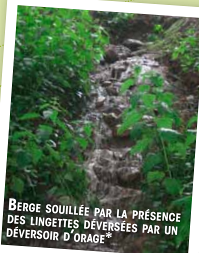
BERGE SOUILLÉE PAR LA PRÉSENCE DES LINGETTES DÉVERSÉES PAR UN DÉVERSOIR D'ORAGE*

Le temps passé dans les canalisations ne permet pas leur dégradation, car les eaux usées transitent des habitations aux stations d'épuration en quelques minutes seulement.