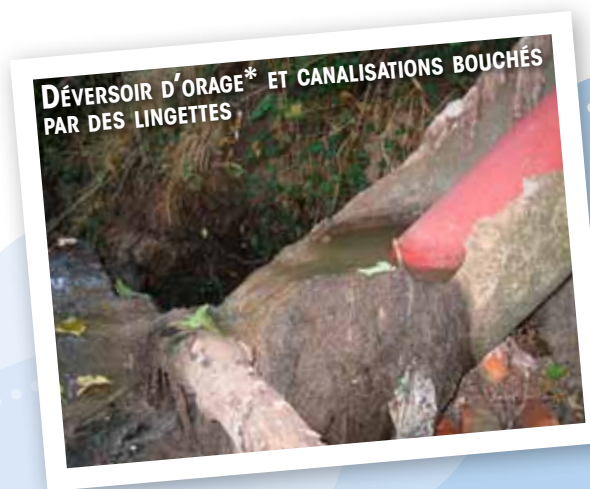
DÉVERSOIR D'ORAGE* ET CANALISATIONS BOUCHÉS PAR DES LINGETTES

Les conséquences induites par la présence des lingettes dans le « tout à l'égout » sont une dégradation de la qualité de l'eau des milieux aquatiques par le rejet régulier d'eaux usées dans les rivières et une pollution par les déchets qui menace la vie aquatique.