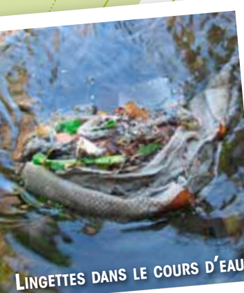
LINGETTES DANS LE COURS D'EAU