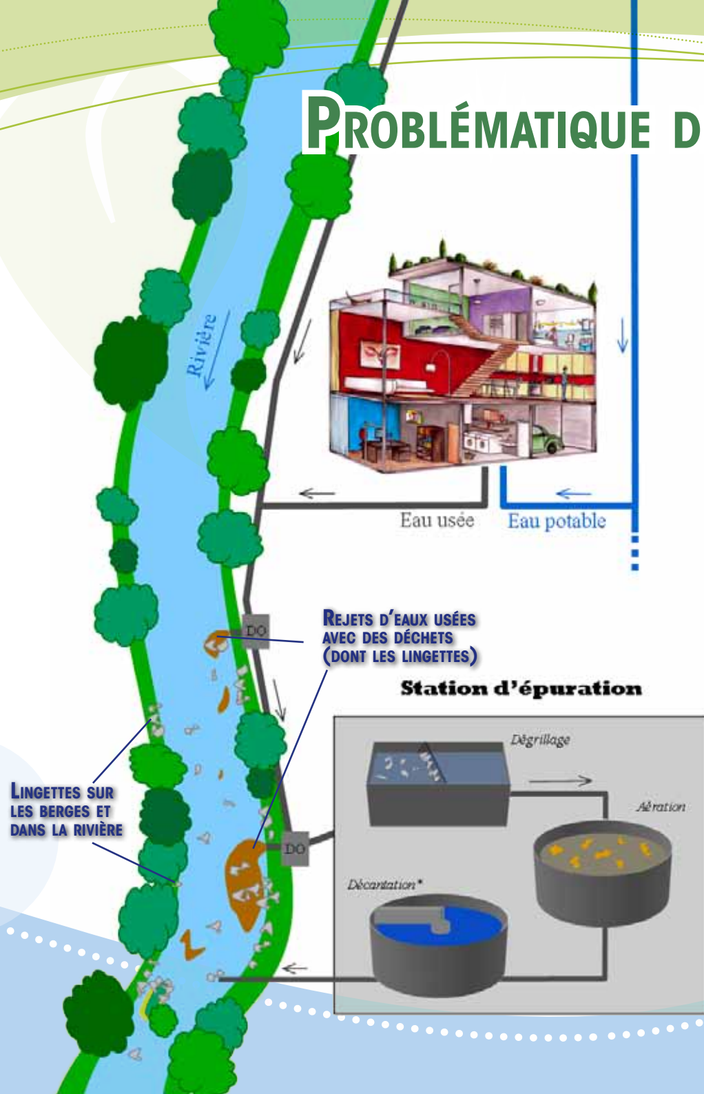
LINGETTES SUR LES BERGES ET DANS LA RIVIÈRE