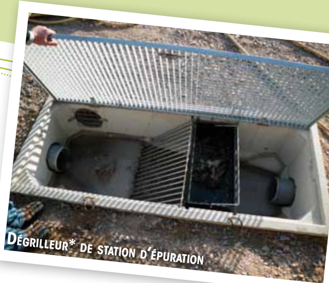
DÉGRILLEUR* DE STATION D'ÉPURATION

Ainsi, le temps passé et l'entretien du matériel font augmenter le coût de fonctionnement et d'exploitation des installations.